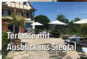
Terrasse mit Ausblick ins Siegtal